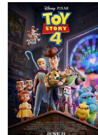
TOY STORY 4